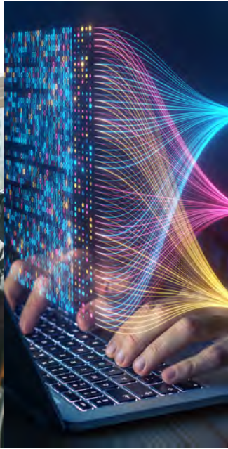
Alternative Strategien Alternative Strategies

NEUE WEGE GEHEN MIT ALTERNATIVEN INVESTMENTS