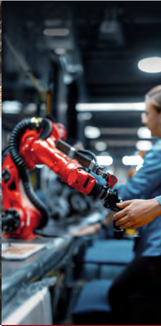
Unternehmens- finanzierung Private Debt