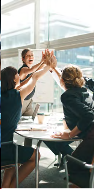
Unternehmens- beteiligung Private Equity